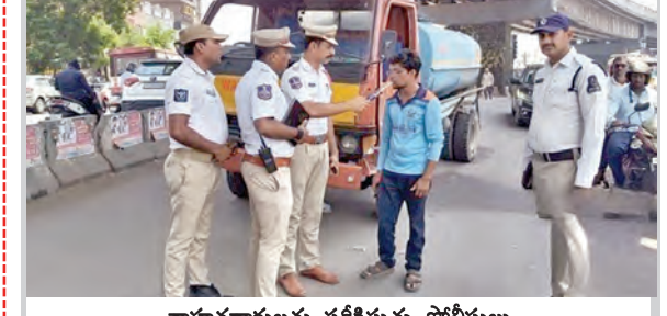
వాహనదారులను పరీక్షిస్తున్న పోలీసులు