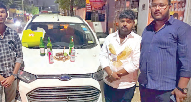
పోలీసులు అదుపులోకి తీసుకున్న యువకులు

కారుపై మద్యం సీసాలు కేక.. యువకులను అదుపులోకి తీసుకున్న పోలీసులు