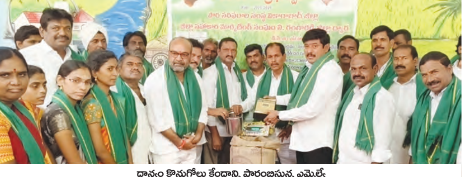
ధాన్యం కొనుగోలు కేంద్రాన్ని ప్రారంభిస్తున్న ఎమ్మెల్యే