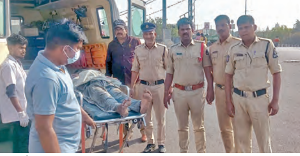
మూసీలో దూకిన వ్యక్తిని ఉస్మానియా ఆసుపత్రికి తరలిస్తున్న పోలీసులు