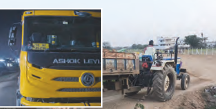
బైర్ ఖాన్ పబ్లిక్ మిట్టం అక్రమంగా మట్టి తరలిస్తున్న వాహనాలు(ఇన్సెక్టి)అర్బరాత్రి గ్రామస్థులు అడ్డుకున్న వాహనం

పోలీసులకు సమాచారం ఇచ్చినా సకాలంలో రాలేదని ఆందోళనకారుల ఆగ్రహం