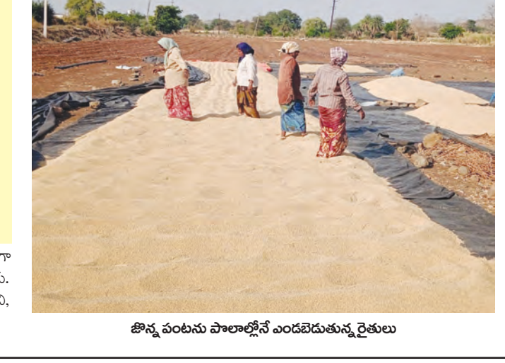
జొన్న పంటను పాలాల్లోనే ఎండబెడుతున్న రైతులు