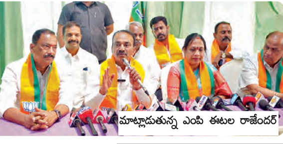
మాట్లాడుతున్న ఎంపి ఈటల రాజేందర్