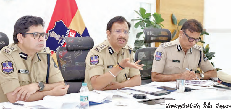
మాట్లాడుతున్న వీసీ సజ్జనర్

హైదరాబాద్, మే 3 ప్రభాతవార్త : రాజ్ యే బట్లీ వంతులకు పురస్కారం కాగా నగరంలో శాంతిభద్రతల పరిరక్షణకు తీసుకోవాల్సిన జాగ్రత్తలపై హైదరాబాద్ పోలీసు కమిషనర్ వీసీ సజ్జనర్ వివిధ గోరక్షక సంఘాల ప్రతినిధులతో బంజారా హిల్స్‌లోని టీజీఐసీసీలో ప్రత్యేక సమన్వయ సమావేశం నిర్వహించారు. ఈ సందర్భంగా ఆయన మాట్లాడుతూ, పండుగ సేక నగరంలో పిలాలంటి అవాంఛనీయ సంఘటనలు జరగకుండా కమిషనర్ లేట్ సరిహద్దుల్లో చెక్ పోస్టులను ఏర్పాటు చేస్తూ పకడ్బందీ చర్యలు తీసుకుంటున్నామని తెలిపారు. ముఖ్యంగా గోరక్షకులు చట్టం పట్ల అత్యంత గౌరవంతో ఉండాలని, అక్రమ కేవల రవాణాకు సంబంధించి ఎలాంటి సమాచారం ఉన్నా తక్షణమే పోలీసులకు తెలియజేయాలి తప్ప, ఏ పరిస్థితుల్లోనూ నిందితులపై ప్రత్యేక దాడులకు పాల్పడి చట్టాన్ని తేల్చుకోకూడదని స్పష్టం చేశారు. నిబంధనలు అతిక్రమించే వారైతే కఠినంగా వ్యవహరిస్తామని హెచ్చరించారు. పశుపక్షుల సంబంధించి ప్రజల మనోభావాలను దెబ్బతీసేలా లేదా ఉద్రిక్తతలు పెంచేలా సోషల్ మీడియాలో రీల్స్, వీడియోలు పోస్ట్ చేసే వారిపై తీవ్రమైన క్రిమినల్ కేసులు నమోదు చేయాలని అధికారులను ఆదేశించినట్లు వెల్లడించారు. పండుగ సేక పోస్టుల వద్ద పోలీసులతో కలిసి వెళ్లకూడదని, పశుపక్షుల ఫోటోలు తీయడం లేదా నిందితుల వివరాలను సోషల్ మీడియాలో పేర్కొనడం వంటి పనులు చేయూడని సూచించారు. పోలీసులతో సమన్వయం